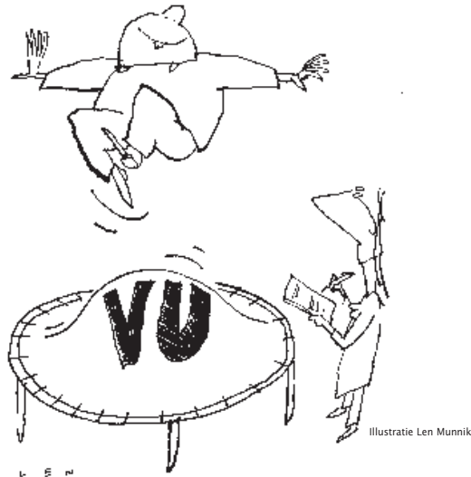
Illustratie Len Munnik

Als stimulans en als dank voor de inzet worden 25 boekenbonnen van 25 euro onder de inzenders verloot.