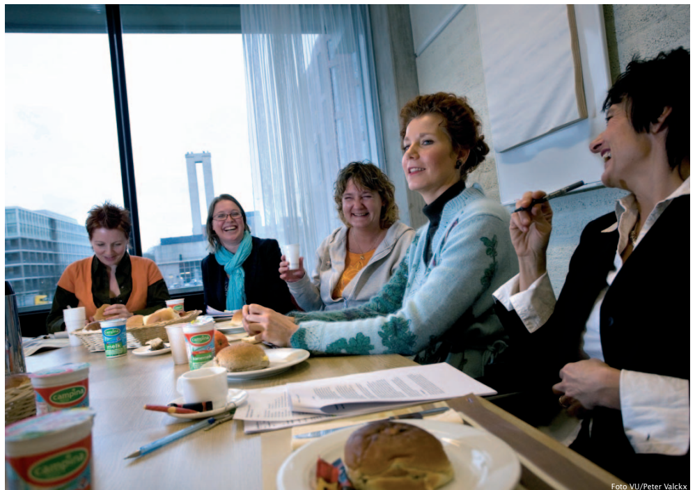
De secretaresses zitten te springen om een digitale community, een secretaressessteunpunt, waar ze hun best practises kunnen delen.

Meer profiteren van elkaars kennis en ervaring. Dat willen de secretaresses van de VU. Ze adviseren HRM over hun eigen beroepsgroep.